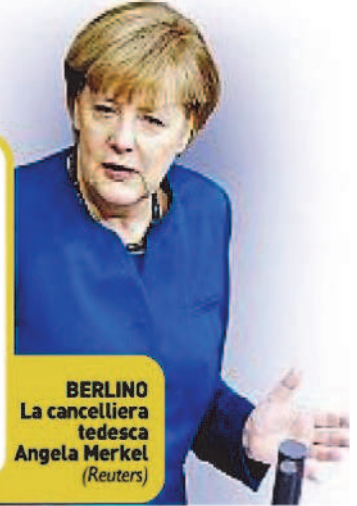
BERLINO La cancelliera tedesca Angela Merkel

Per la prima volta dal 2009 i salari reali hanno fatto segnare in Germania un calo nel 2013. Gli occupati tedeschi si sono ritrovati in busta paga lo 0,3% in meno rispetto al 2012.