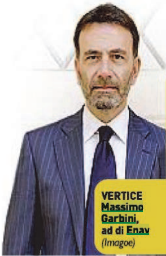
VERTICE Massimo Garbini, ad di Enav