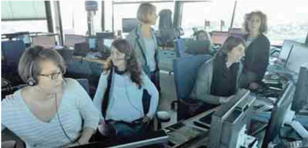
Turno di lavoro tutto al femminile nello staff Enav in torre di controllo a Fiumicino