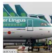
IL MISTERO "CANNIBALE" A BORDO Un 24enne morde il vicino durante il volo e poi muore sull'aereo di Federica Macagnone