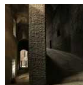
ARCHEO-SHOW A Roma apre la Rampa Domiziana, la "porta segreta" degli imperatori di Laura Larcari