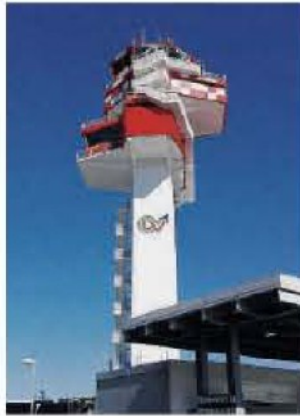
La Torre. È uno dei simboli dell'aeroporto Leonardo da Vinci

I lavori, durati circa 9 mesi, hanno riguardato sia gli interni sia l'esterno, dove è ancora più evidente la «chioc-