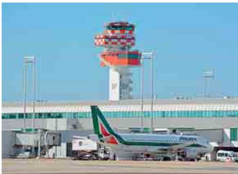
LA TORRE DI CONTROLLO