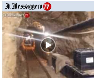
IL TUNNEL DELLA DROGA - La galleria dei trafficanti scoperta fra Messico e Usa