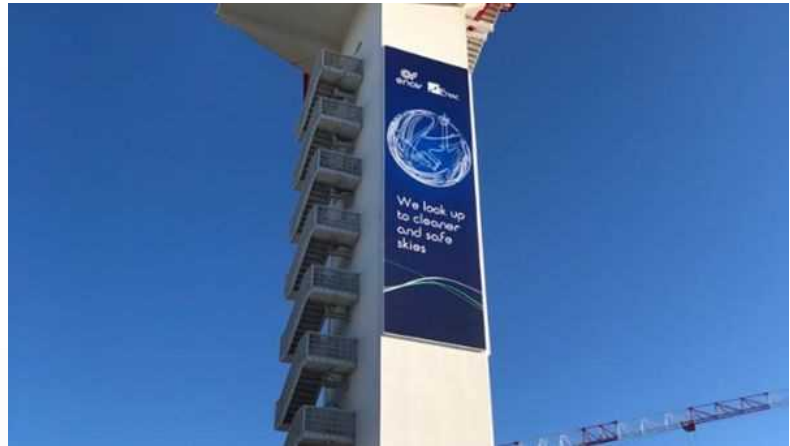
"We look up to cleaner and safe skies", il claim utilizzato