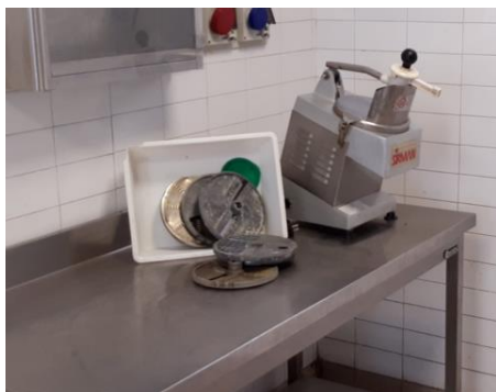
Tagliaverdure con dischi