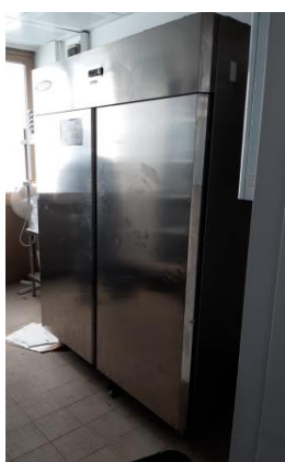
Armadio frigo mm 1480