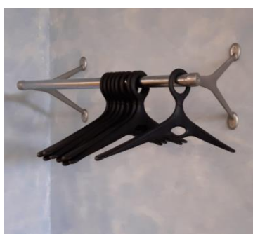
Barra porta ometti