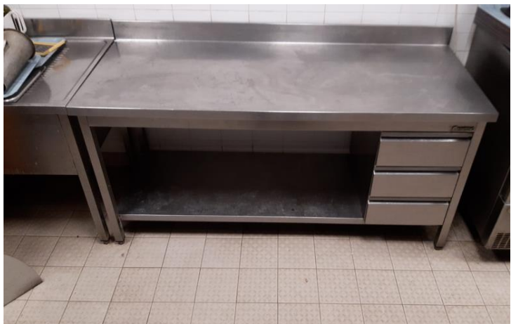
Tavolo da lavoro con cassetteria mm 2000