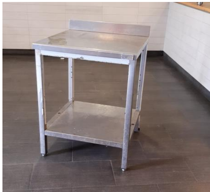
Tavolo da lavoro mm 1000