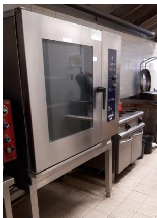
Forno elettrico con boiler