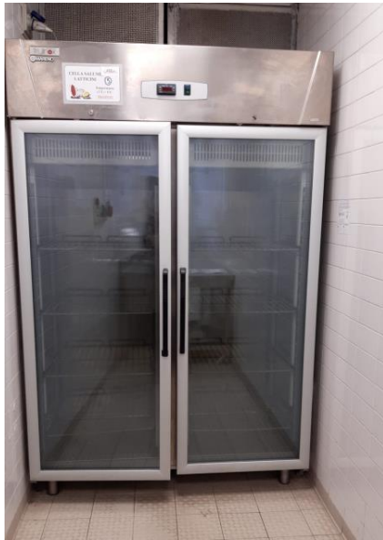
Armadio frigo vetrinato mm 1480