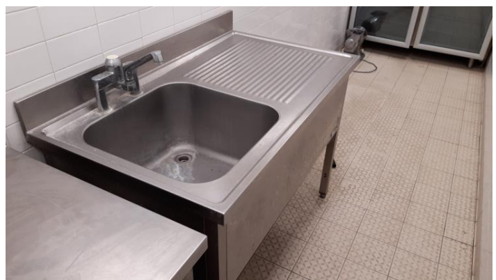
Lavello una vasca sgocciolatoio mm 1400