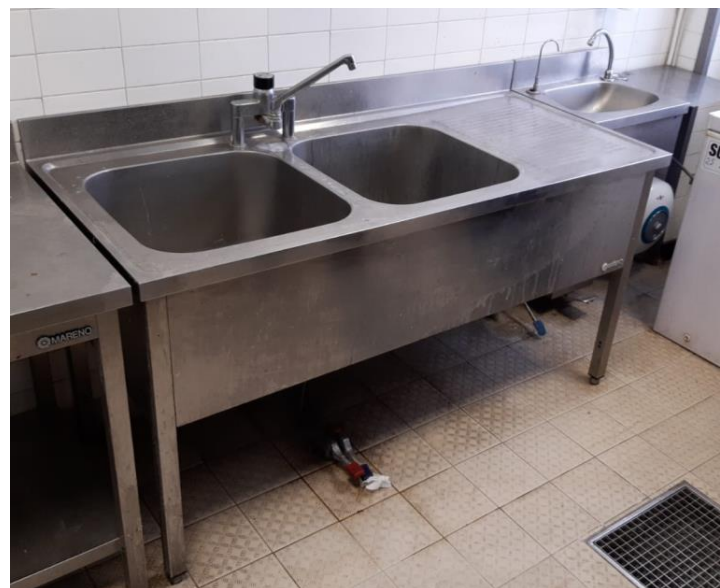
Lavello 2 vasche sgocciolatoio mm 1600