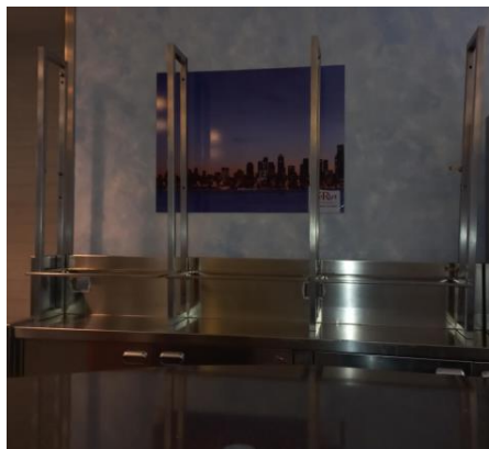
Retrobanco in acciaio con mensole in vetro