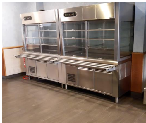
Elementi con vetrina refrigerati