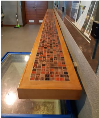
Mensola a muro