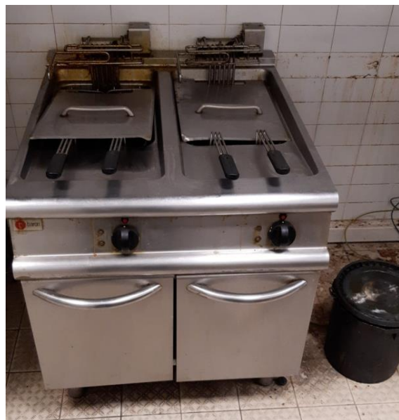
Friggitrice elettrica doppia