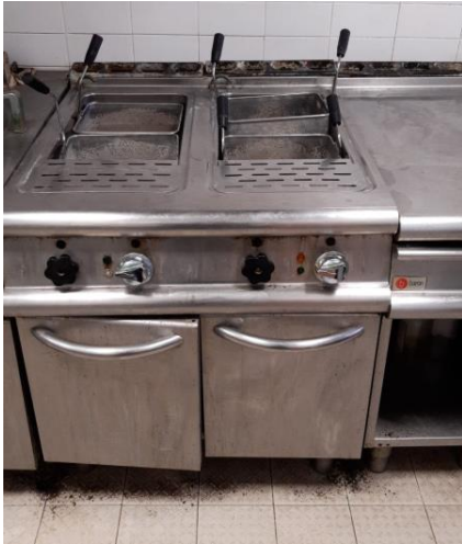
Cuocipasta elettrico 2 vasche mm 800