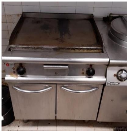
Fry top elettrico piastra liscia