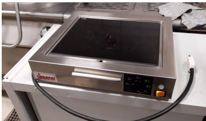
Elemento neutro di cottura mm 400