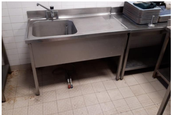
Lavello una vasca