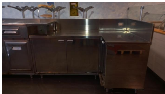
Mobile in acciaio