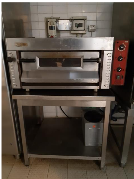
Forno pizza e relativo tavolo