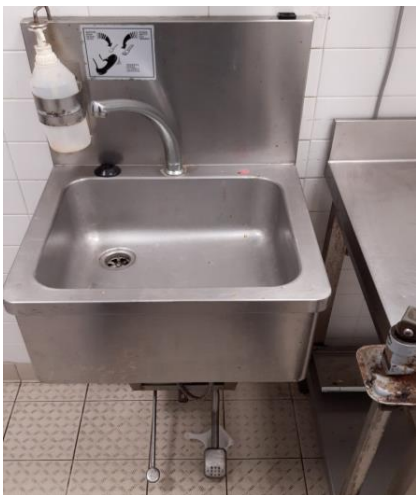
Lavello 1 vasca sgocciolatoio mm 1200