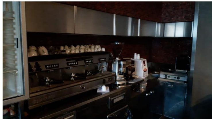
Cappe Aspirante modulare con rivestimento in acciaio