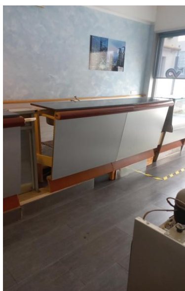
Modulo banco lavabo