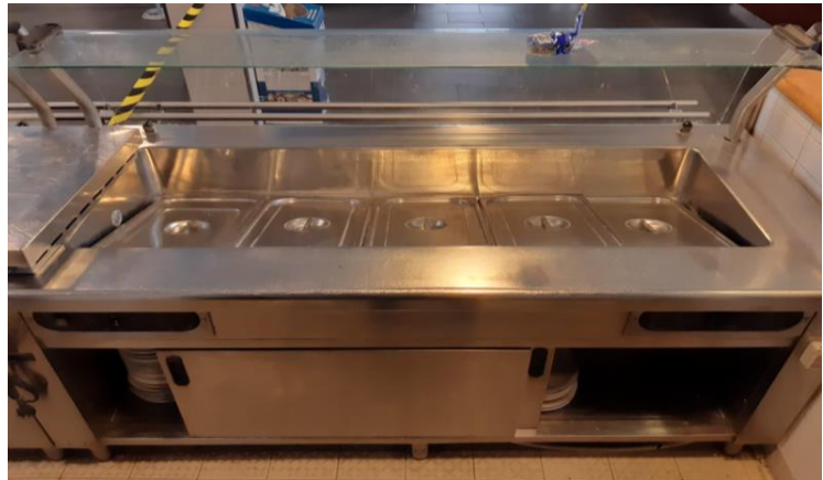
Elemento bagnomaria per piatti caldi