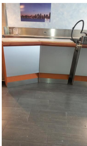
Modulo banco cassa