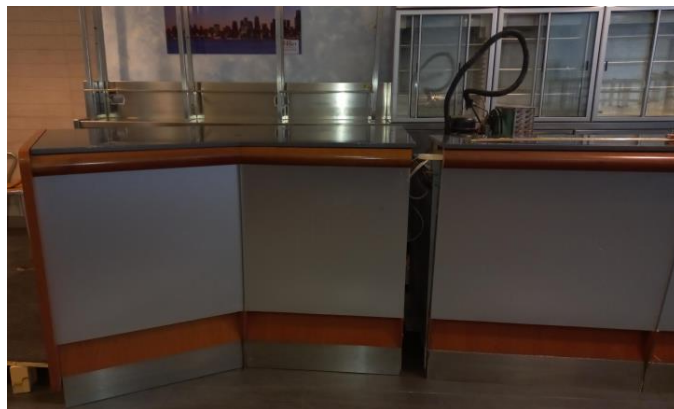
Modulo banco cassa