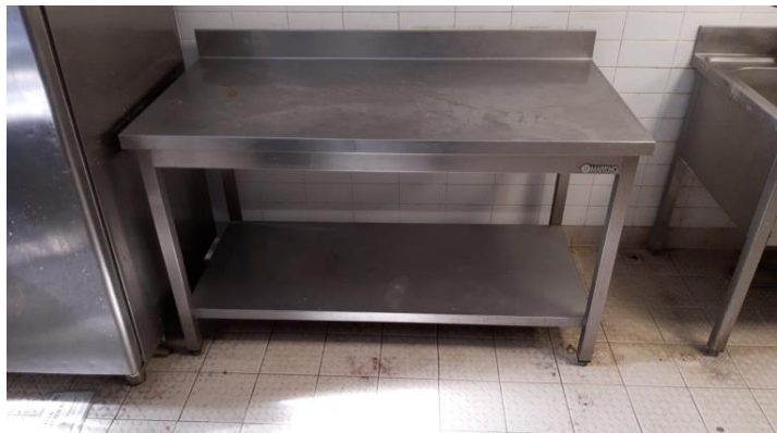
Tavolo da lavoro mm 1400