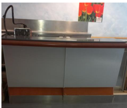
Modulo banco frigoriferi