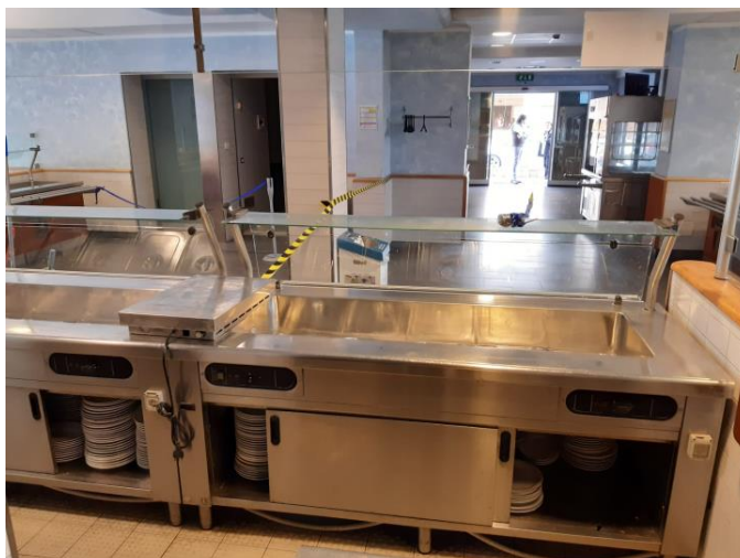
Elemento bagnomaria per piatti caldi