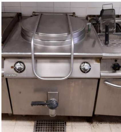
Pentola bollitore 150 lt