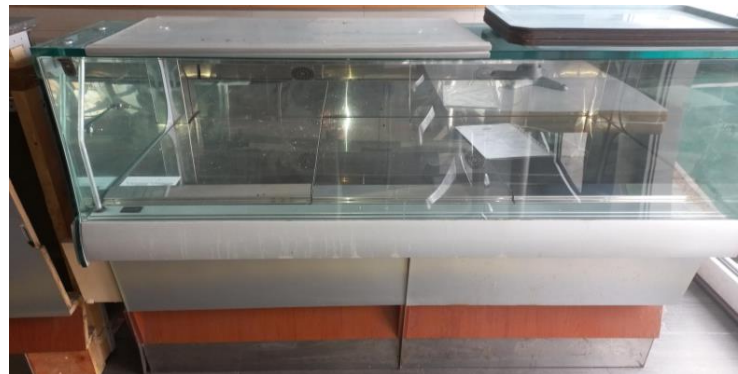
Vetrina espositiva calda