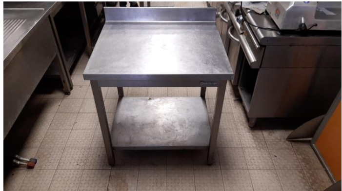
Tavolo da lavoro mm 1200