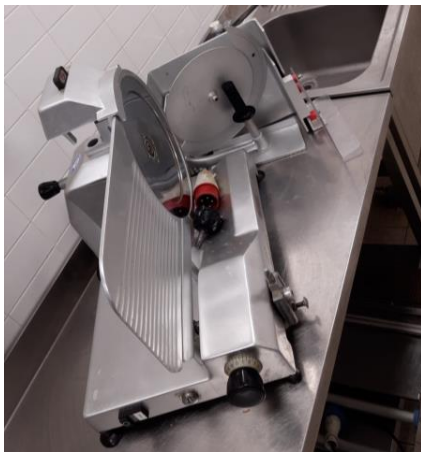
Affettatrice lama mm 350