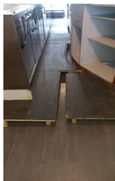
Pedana modulare in legno rivestita