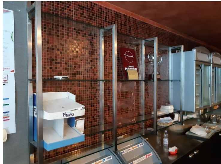
Dietro banco in acciaio con mensole in vetro