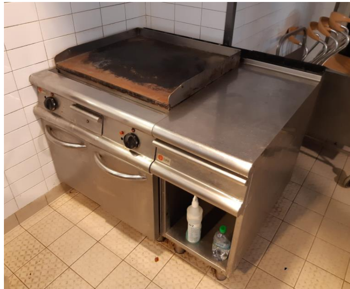
Fry top elettrico piastra liscia