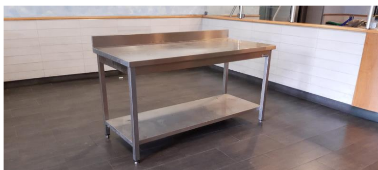
Tavolo preparazione pesce mm 1600