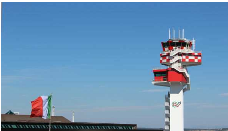
Attraverso le società IDS AirNav e Techno Sky