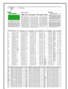
Superficie 2 %

ARTICOLO NON CEDIBILE AD ALTRI AD USO ESCLUSIVO DEL CLIENTE CHE LO RICEVE - 1031 - L.1737 - T.1737