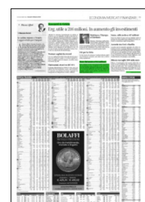
Superficie 2 %

ARTICOLO NON CEDIBILE AD ALTRI AD USO ESCLUSIVO DEL CLIENTE CHE LO RICEVE - 1031 - L.1620 - T.1623