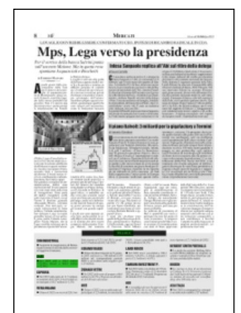
Superficie 1 %

ARTICOLO NON CEDIBILE AD ALTRI AD USO ESCLUSIVO DEL CLIENTE CHE LO RICEVE - 1031 - L.1956 - T.1623