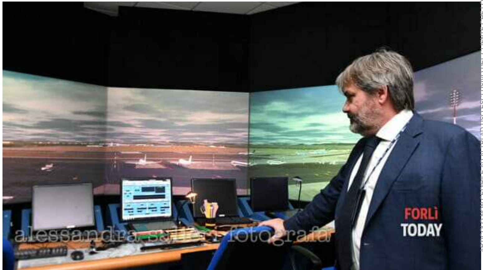
Il simulatore di

Nel grande edificio a specchi, una sorta di avveniristico triangolo che sfida le forme usuali a parallelepipedo dei normali palazzi, in via Carnaccini, a ridosso del sedime dell'aeroporto si trova dal 2017 la nuova e moderna sede del centro di formazione Enav , che prima prendeva il nome di Enav Academy . Enav , l'ex ente degli assistenti al volo, ora una Spa quotata in Borsa che ha lo stato come socio di maggioranza (al 53% il ministero dell'Economia) dal 2005 ha scelto Forlì come centrale della sua unica scuola di formazione.