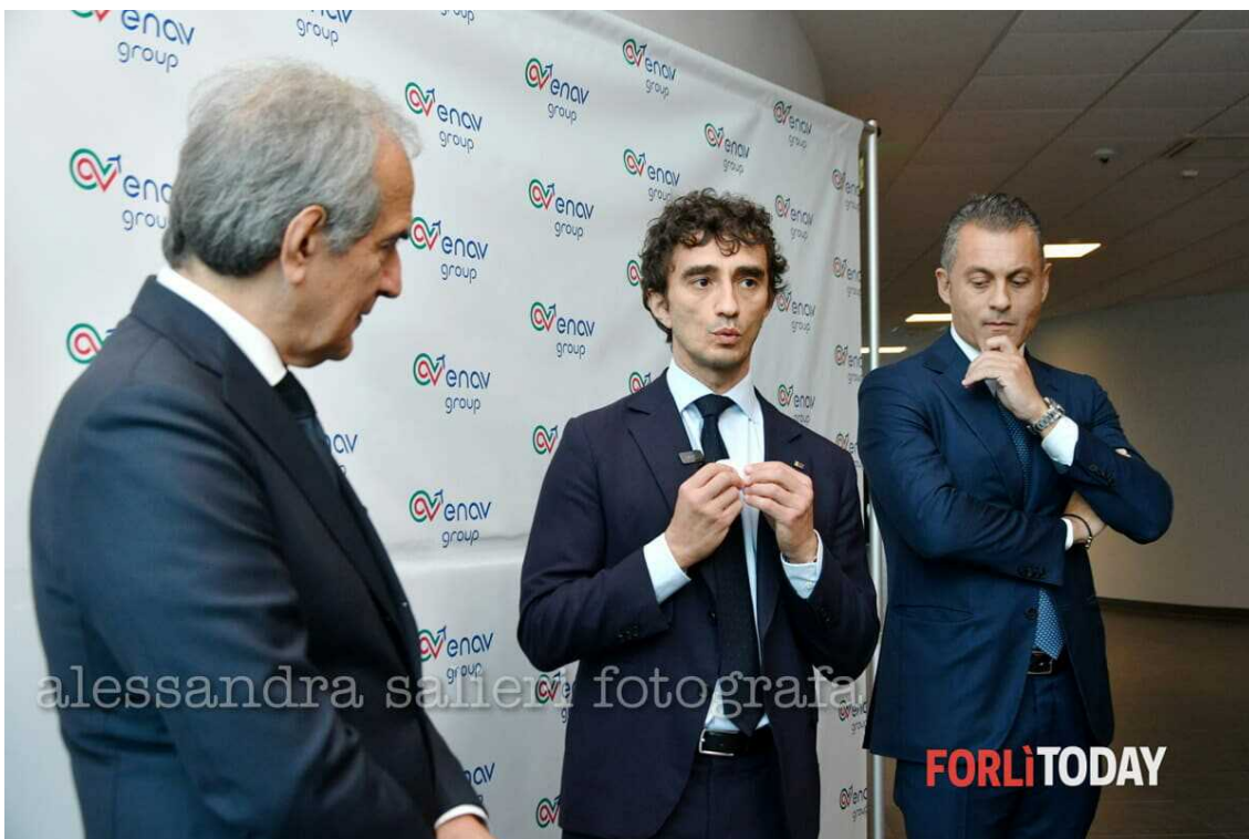
zattini bignami monti

Foto da: La visita al centro di formazione Enav