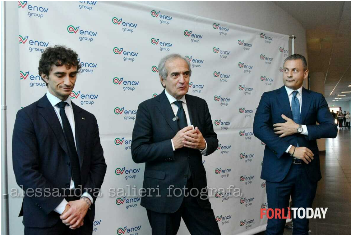
zattini bignami monti 2

Foto da: La visita al centro di formazione Enav