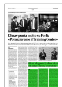
Superficie 13 %