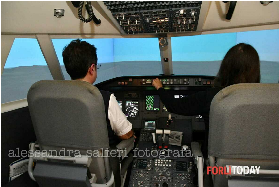
simulatore di volo Enav