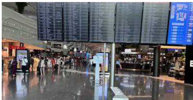
Voli nel 2025, il Mediterraneo trascina l'Europa

ENAV nel 2025 ha gestito 2,4 milioni di voli sullo spazio aereo italiano. Un record assoluto che conferma il trend di crescita per l'Italia con la migliore performance tra i principali Paesi europei. Infatti, le unità di servizio di rotta hanno registrato un incremento del 5,9%, rispetto al 2024, superando Spagna (+5,6%), Gran Bretagna (+4,2%), Germania (+4%) e Francia (+3,6%). Tali risultati positivi sono confermati anche dall'andamento del traffico passeggeri nel sistema aeroportuale italiano che ha visto transitare, nel 2025, circa 230 milioni di passeggeri (+5% rispetto al 2024) con un traffico nazionale pari a 72,6 milioni di passeggeri, tendenzialmente stabile rispetto al 2024, e un traffico internazionale che ha raggiunto 157,2 milioni di passeggeri, con una crescita del 7,6% rispetto al 2024.